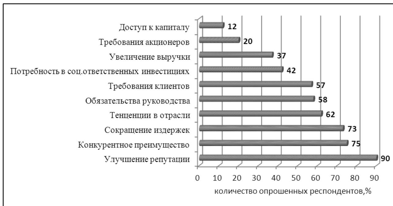
Рис. 1. Мотивы применения КСО мировыми компаниями (составлено по данным [4])

Ежегодно консалтинговые организации проводят исследования в сфере мотивов применения КСО мировыми компаниями (рис. 1). Согласно полученным результатам, основным мотивом применения КСО является стремление повысить репутацию, тем самым обеспечить конкурентное преимущество.