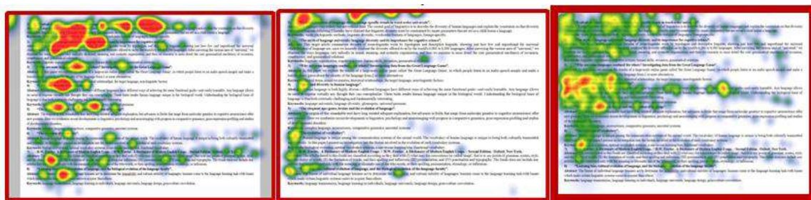
Рис. 2. Визуальный поиск с применением стратегии «F» при изучении любого типа документа

Рассматривая поиск информации как деятельность по решению проблемы, можно различить два типа знаний, которые обуславливают успех или неудачу в деятельности обучающихся: знание в изучаемой области и процессуальные знания [Галашев, 2011]. С когнитивной точки зрения знания в определённой области соответствуют декларативным знаниям и относятся к таковым по предмету извлечения информации («что?»), тогда как процессуальное знание соответствует процедурам для осуществления деятельности («как?»).