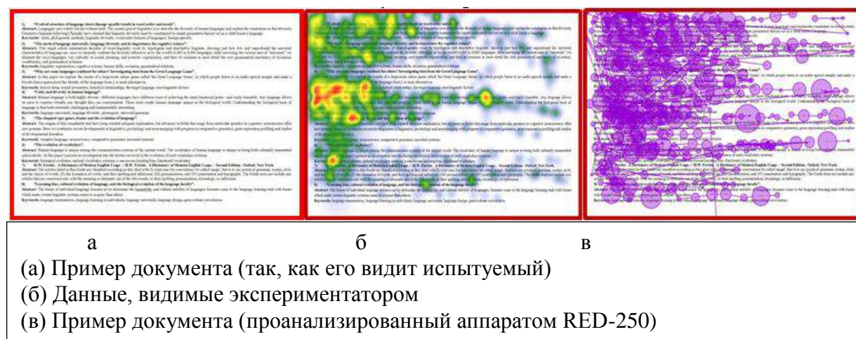
Рис. 1. Методика окулометрии, применяемая к документам, для понимания визуальной разведки

Существенное преимущество окулометрии заключается в обеспечении временного и пространственного хода когнитивных операций, связанных со временем реализации познавательной деятельности (исследование конкретного). Это позволяет, в частности, отличать начальные когнитивные методы (первые фиксации) от последующих операций контроля, проверки или интеграции информации (чтения).