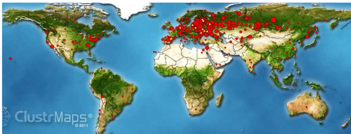
Рис. 2. Карта заходов на сайт Института Культуры ДонНТУ. Самый малый круг – до десяти человек в месяц из данного региона. Самый большой круг – более 1000 человек/месяц из этого города/местности.

С программой, библиотекой, дистанционными курсами, конкурсами знакомьтесь на сайте Института Культуры ДонНТУ [19].