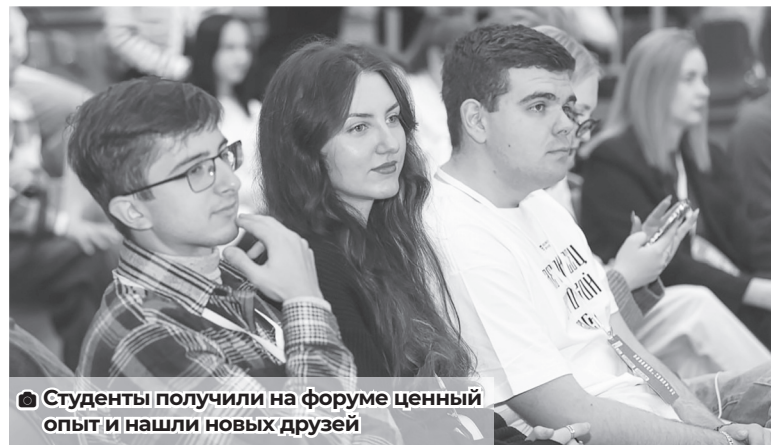
■ Студенты получили на форуме ценный опыт и нашли новых друзей