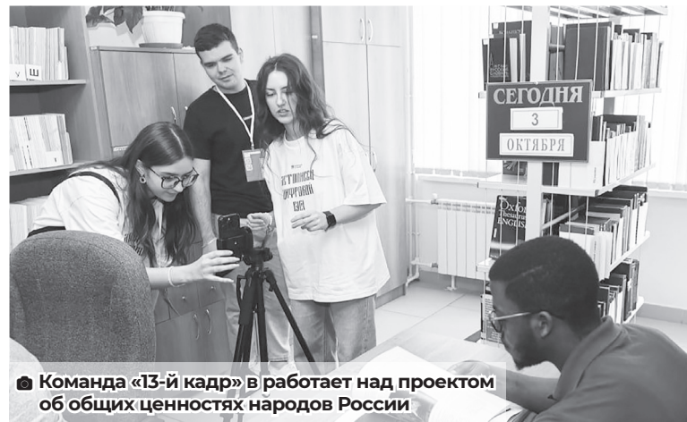
■ Команда «13-й кадр» работает над проектом об общих ценностях народов России

На медиафоруме проводились лекции, семинары, мастер-классы. Кроме этого, студентов-участников объе-