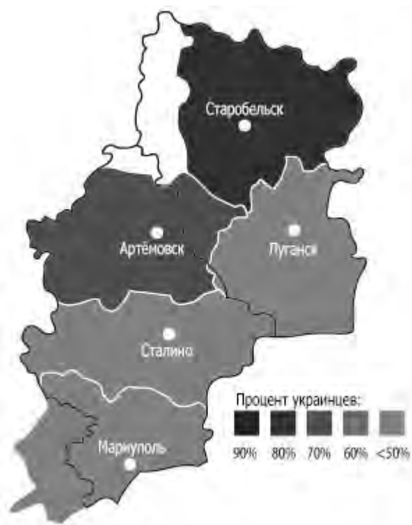
Карта 1. Донецкая и Луганская области

Давайте рассмотрим округа, которые теперь составляют восточные Донецкую и Луганскую области (см. карту 1) [2]: