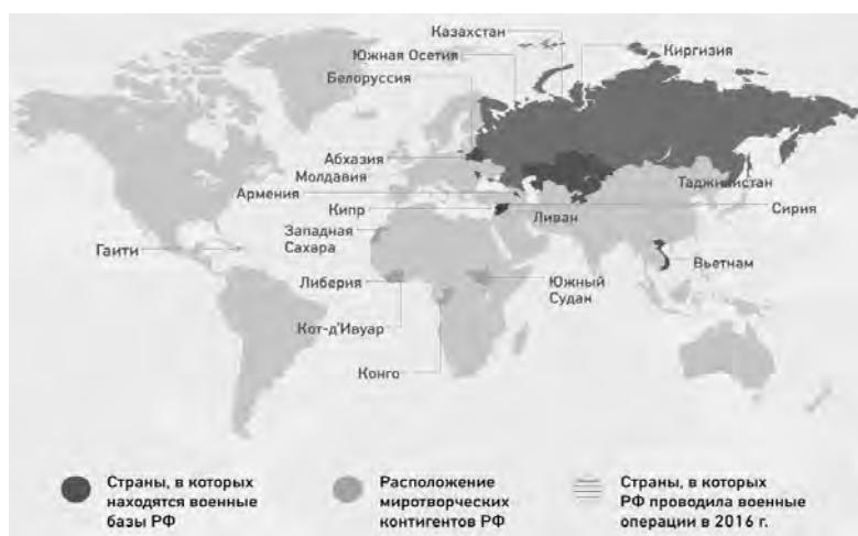
Рис. 1. «Военное присутствие России в мире»

Согласно статистике ООН, на начало 2017 года в девяти миссиях ООН находились 105 российских миротворцев (Рис. 1). Из них 41 человек выполняет полицейские функции (среди них – шесть женщин), а 64 выступают в качестве военных наблюдателей. При этом шесть женщин из России участвуют в миссиях по поддержанию мира в Африке и на Ближнем Востоке.