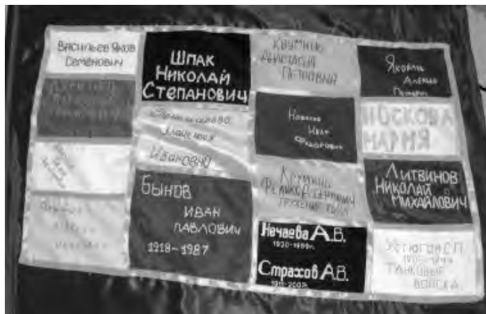
Рис. 2. Флаг памяти из детского сада № 5 с. Карагай Приобвинского края Карагайского муниципального района [3]. На красное полотнище, взятое в качестве основы, нашиты вышитые потомками героев II Мировой войны и тружеников тыла фамилии, имена и отчества, а также в некоторых случаях даты жизни их предков

В основном, в мировой вексиллологической практике, помимо регламентированных флагов (для армии, авиации и флота), флаги являются напоминанием о победах и достижениях предков. Это могут быть как овеянные славой боевые знамена, так и флаги, сделанные специально, для сохранения памяти, например, для детей (рис. 2). Флаг на (рис. 1) уникален тем, что создан потерпевшей поражение стороной цивилизационного конфликта, принявшего крайне острые формы на юго-востоке Украины.