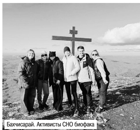
Бахчисарай. Активисты СНО биофака