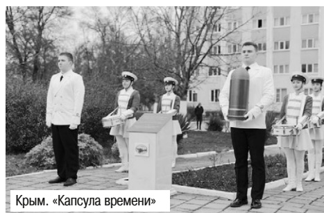
Крым. «Капсула времени»

На каждом факультете Донецкого государственного университета успешно функционируют студенческие научные общества, которые из года в год привлекают энергичных ответственных студентов, готовых вдохнуть новые идеи. Одним из них является СНО биологического факультета. Основное направление деятельности сообщества – формирование исследовательских компетенций и поддержка научно-исследовательской, инновационной и просветительской работы среди студентов.