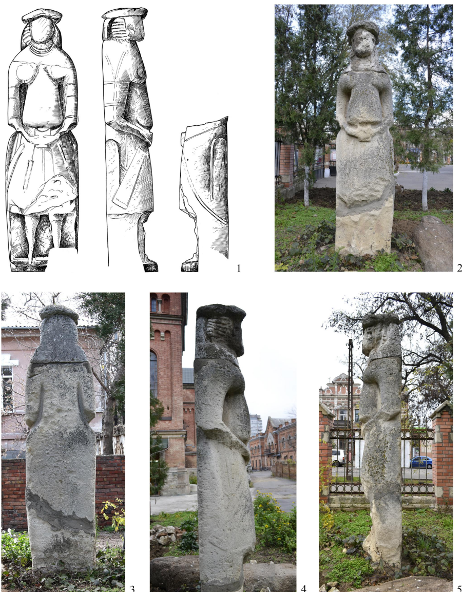
Рис. 1. Половецкое изваяние из Николаевского краеведческого музея: 1 – по С.А. Плетневой; 2-5 – общий вид спереди, сзади, в профиль.

подвергла сомнению вывод о наличии «амазонок» в половецком обществе [5, с. 51-57]. Наличие матриархальных пережитков и высокого общественного положения половчанок не означает, что они жили отдельно от мужчин. А именно отдельное проживание является главным в институте «амазонства». Тогда же была выдвинута версия о том, что хранящееся в Николаеве изваяние является подделкой [5, с. 53-54]. Было обращено внимание, что данная статуя по ряду признаков резко отличается от всех опубликованных экземпляров. В 2012 г. вышла статья с детальной аргументацией мнения о скульптуре из Николаева как о подделке [6, с. 27]. В 2013 г. А.В. Евглевский произвел фотофиксацию скульптуры с разных ракурсов.