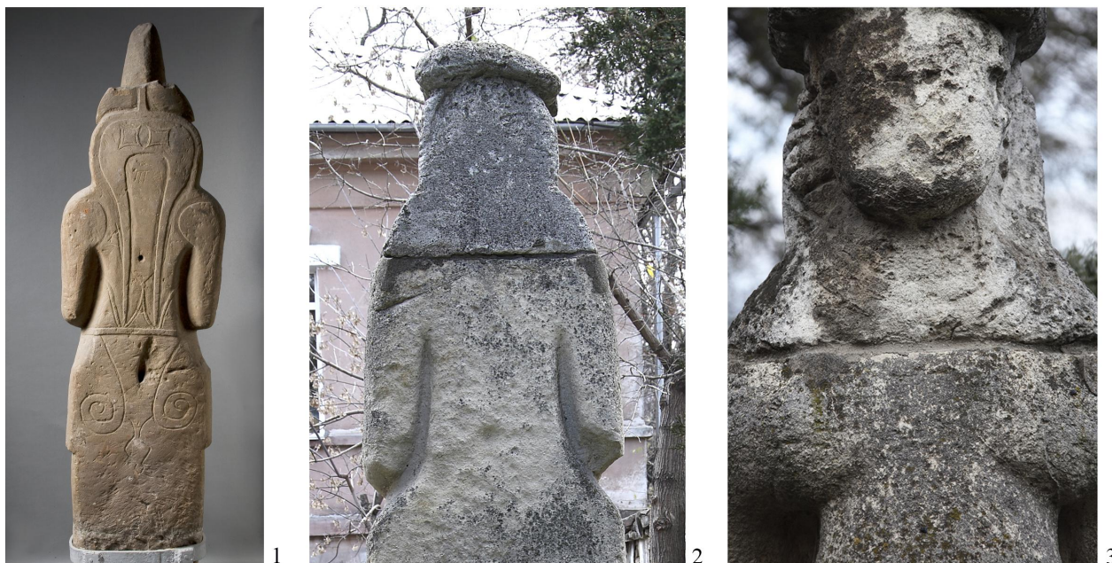
Рис. 4. Отдельные детали иконографии: 1 – тыльная сторона половецкого изваяния из Эрмитажа; 2 – тыльная сторона бюста изваяния из Николаева; 3 – лицо и гривны бюста изваяния из Николаева (1 – фото Д.А. Боброва; 2, 3 – фото А.В. Евглевского).

изготавливал, не имел перед собой настоящего образца и, скорее всего, не понимал, как и что ему нужно было сделать. В результате изящно изогнутая широкополая шляпа с подтреугольным (или округлым) козырьком, типичная для женских половецких изваяний (рис. 3, 1), у него превратилась в толстый горизонтально расположенный “блин”, к тому же вогнутый надо лбом (рис. 3, 2). Украшавшие головной убор “рога” (рис. 3, 3) на подделке явно похожи на букли мужского парика XVIII в. (рис. 3, 4). Боковые стороны накладки (или лопасти) на тыльной стороне головы поддельного бюста не имеют никакого продолжения, как это обычно для такого типа скульптур (рис. 4, 1). Здесь же – просто плоская гладкая поверхность без каких-либо изображений (рис. 4, 2).