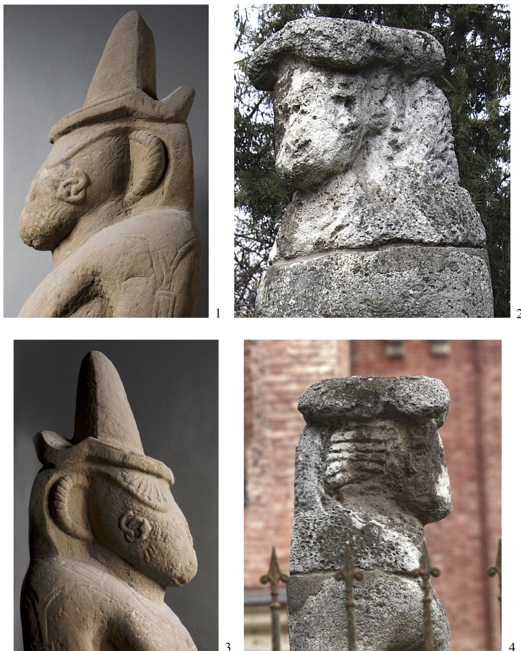
Рис. 3. Изображение шляп и “рогов”: 1, 3 – половецкое изваяние из Эрмитажа; 2, 4 – бюст изваяния из Николаева (1, 3 – фото Д.А. Боброва 1 ; 2, 4 – фото А.В. Евглевского).

постаменту ниже трещины (рис. 2, 3). Таким образом, несмотря на разный цвет камня, нет сомнений, что нижняя часть постамента составляет единое целое с мужской фигурой.