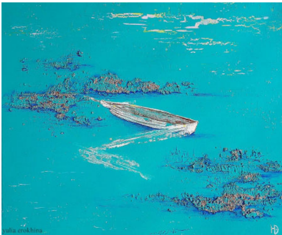
Figure 2. Yu. Erokhina The Island of Childhood. 2017

change their minds. This case demonstrates a warped perception of a symbol, when the audience offers their own interpretation of the image, disregarding its context and time of creation.