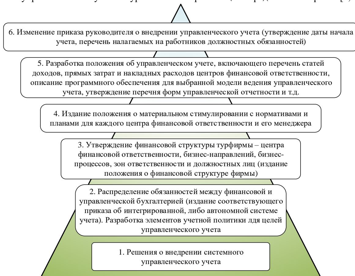
Рис. 1. Алгоритм постановки системы управленческого учета в туристических организациях

Сегодняшний уровень управленческого учета в большинстве отечественных туристических компаний еще не является целостной системой сбора, анализа и предоставления информации для принятия краткосрочных и долгосрочных решений руководством. Основной целью туристических фирм является выбор наиболее перспективной бизнес-модели, способствующей увеличению прибыли за счет роста деловой активности и оптимизации внутренних издержек. Это предполагает планирование туристического продукта, основным аспектом которого является его себестоимость. Процесс формирования себестоимости турпродукта требует организации эффективной целевой подсистемы финансового управления для обеспечения рациональной структуры затрат и оптимизации калькуляции. Проблема разработки организационно-методических основ управленческого учета в туристических фирмах становится все более актуальной. Алгоритм постановки системы управленческого учета в туристических организациях представлен на рис. 1 [1, с. 36].